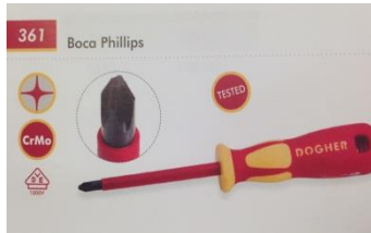
Tornavís estrella (PH1x80mm)