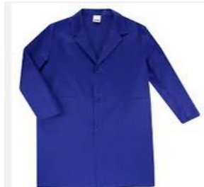
Bata de treball amb l' escut del centre

EPIs.- Els EPIs són els Equips de Protecció Individual destinats a la seguretat de cadascú. Aquests equips han de complir les normes de la Directiva 89/656/CEE . És indispensable disposar dels EPIs per poder accedir a tallers. Els EPI's necessaris són: