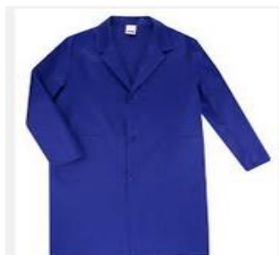
Bata de treball amb l'escut del centre

Les eines necessàries per realitzar les pràctiques seran les descrites en aquest document (peu de rei). Aquestes eines han de complir amb les normes de qualitat pertinents de la CE.