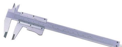
Peu de rei aprec..0,05mm.