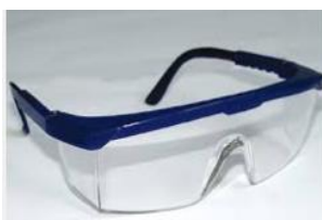
Ulleres de seguretat