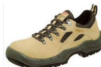
Sabates de seguretat