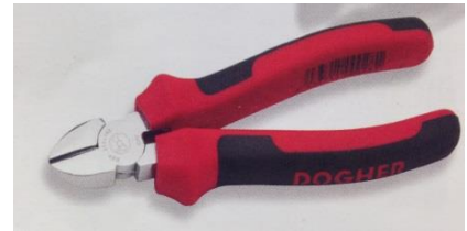
Talla cables amb protecció elèctrica