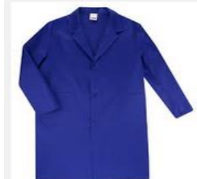
Bata de treball amb l'escut del centre

EPIs.- Els EPIs són els Equips de Protecció Individual destinats a la seguretat de cadascú. Aquests equips han de complir les normes de la Directiva 89/656/CEE . És indispensable disposar dels EPIs per poder accedir a tallers. Els EPI's necessaris són: