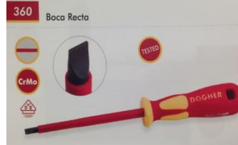
Tornavís pla (5,5x125mm)