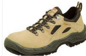
Sabates de seguretat