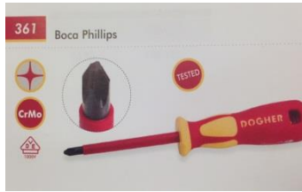
Tornavís estrella (PH1x80mm)