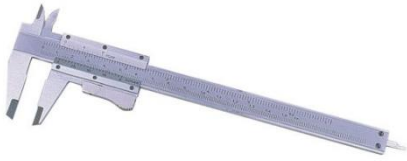
Peu de rei d'acer, tipus Vernier 150mm Aprec.0,05mm.

Eines.- Seran necessàries per realitzar el treball pràctic. Aquestes eines han de complir amb les normes de qualitat pertinents de la CE.